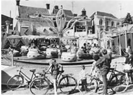
(een sfeer impressie van een kermis)

Na het gebruikelijke kermisreces, van 2 weken, hadden wij, op maandag 21 oktober 2013, de eerste avond van ons RAPID toernooi. (30 december 2013 is de tweede avond) Martin Honkoop deed mee en Ries van Raaphorst kwam eens kijken hoe het er bij onze vereniging aan toe gaat.