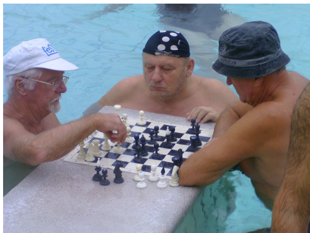
(Boedapest 2012, in het thermenbad (38 graden warm) worden continu schaakpartijtjes gespeeld)